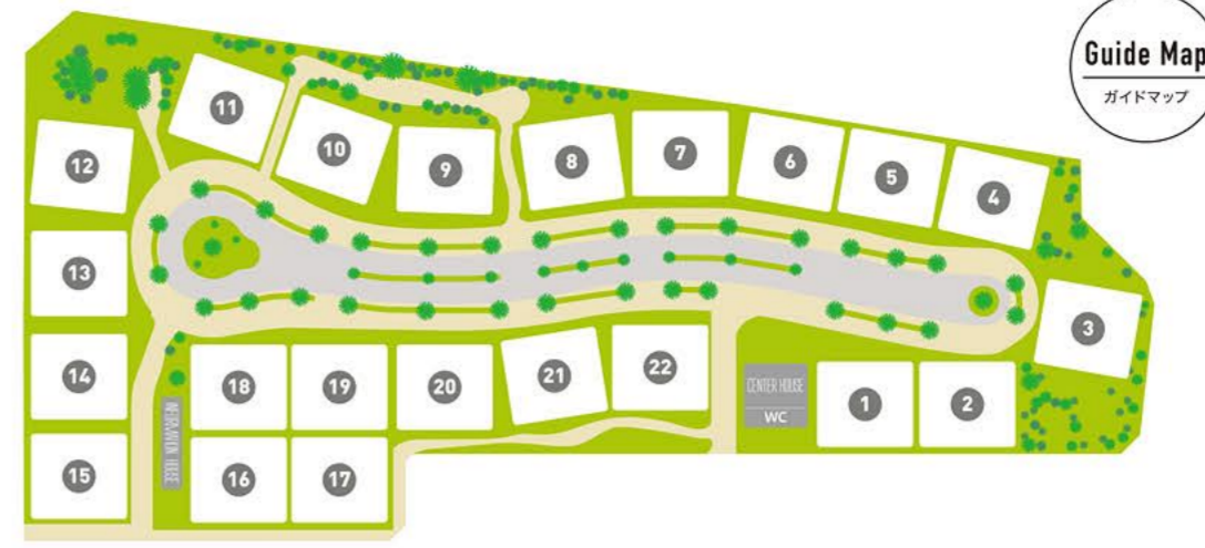
Guide Map ガイドマップ

COURT YARDのある暮らし ～豊かさを生む+αな空間～ 自然を感じながら心豊かに過ごすCOURT YARDのある暮らしを体感してください。