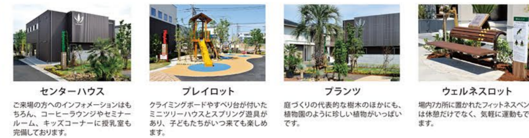
センターハウス ご来場の方へのインフォメーションはもちろん、コーヒーラウンジやセミナールーム、キッズコーナーに授乳室も完備しております。 プレイロット クライミングボードやまわりが付いたミニツリーハウスとスプリング遊具があり、子どもたちがいつ来ても楽しめます。 ブランツ 庭づくりの代表的な樹木のほかにも、植物園のように珍しい植物がいっぱいあります。 ウェルネスロフト 場内から眺めたフィットネスベンチは休憩だけでなく、気軽に運動もできます。

上毛新聞e住まいるプラザ 前橋みなみは、「人、家、地球が繋がる もっと幸せが広がる」を、会場テーマとする「課題の解決策を示す総合住宅展示場です。すべてのモデルハウスは、「スマート、ウェルネス、デザイン」をキーコンセプトとしたスマートハウス仕様。暮らしやすさを追求した、健康的で新しい住まいをご提案します。